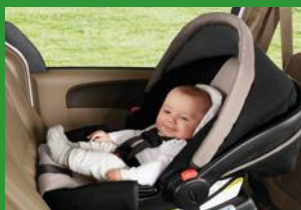
Автокресло группы 0+ (для детей массой < 13 кг)*