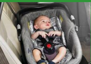
Автокресло «люлька» группы 0 (для детей массой < 10 кг)*

При покупке детского удерживающего устройства обязательно следует уточнить у продавца наличие сертификата на товар!