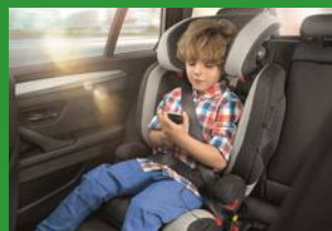
Автокресло группы II и III (для детей массой 15-36 кг)