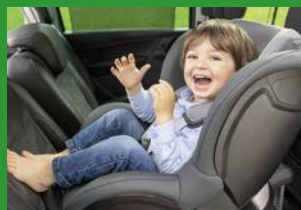
Автокресла групп I (для детей массой 9-18 кг)*