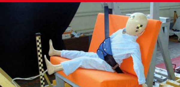
Результаты тестов использования небезопасных удерживающих устройств*

Дополнение определения «направляющая ляжка» в Правилах ЕЭК ООН № 44-04 было одобрено Всемирным Форумом (WP.29). Внесенная поправка к формулировке указывает на то, что «направляющая ляжка» рассматривается как составной элемент детской удерживающей системы и НЕ может отдельно официально утверждаться в качестве детской удерживающей системы в соответствии с настоящими Правилами». Это исключает даже формальную возможность сертификации устройств типа «направляющая ляжка»!